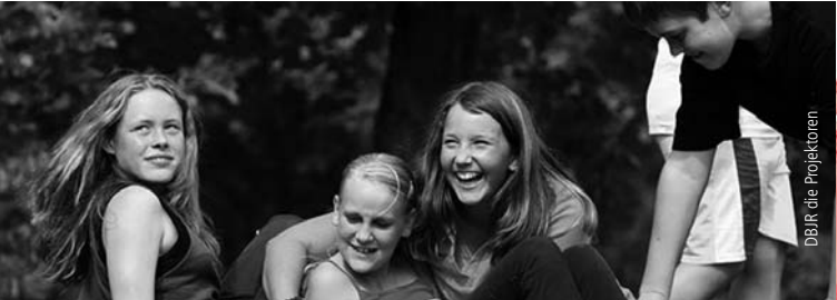
DBJR die Projektoren